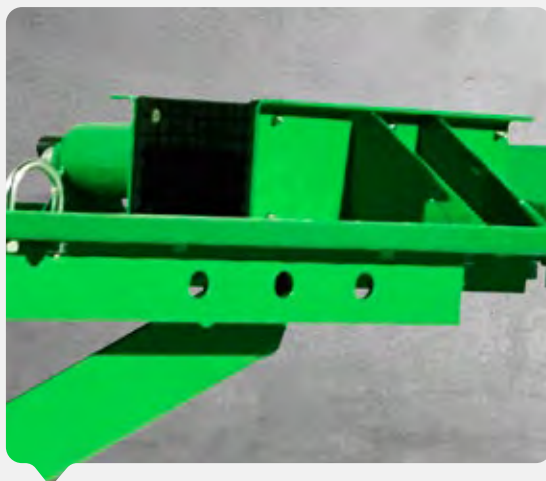
Sistema de trabas mecánico