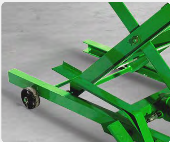
Accionamiento a Pedal