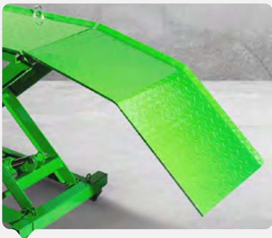
Rampa de ascenso desmontable y antideslizante